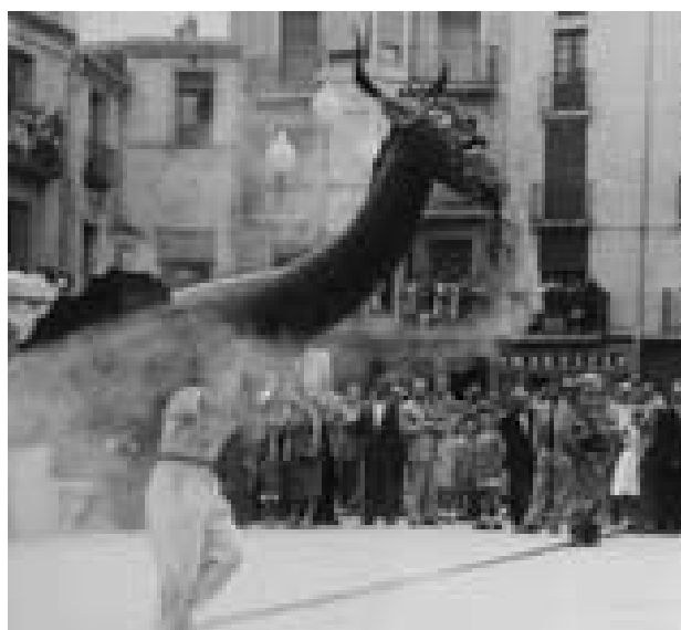
Altre drac el 1954, pots ser del municipi, pots ser del barri de la Font Vella