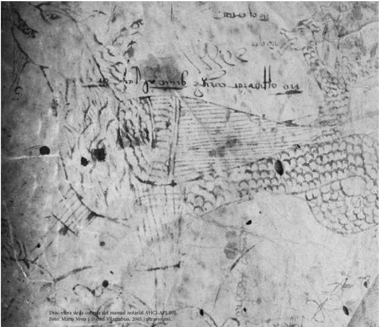
Drac-vibra de la coberta del manual notarial AHCI-API 500. Foto: Marta Vives i Daniel Vilarrubias, 2005 (ultraviolats).