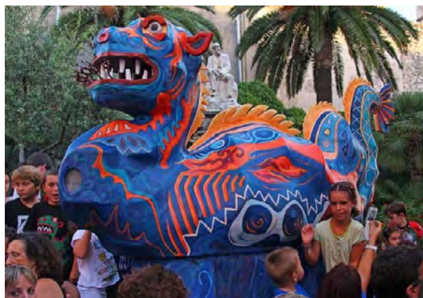
Drac de Sitges (1922), exemple de color aplicat a una fera.

Com que massa ciutats han copiat o recreat el drac de Vilafranca, proposem tenir en compte tots els exemples aportats i basar l'estètica del punt més important (el cap) en una escultura històrica, en aquest cas una figura d'un nivell artístic molt elevat i amb una policromia que resultaria força impactant, ja que les peces històriques de bestiar festiu conservades tenen els colors esmorteïts o, directament, han estat repintades amb un sol color. També es tractaria de reincorporar aquesta figura d'una manera determinada, recuperant les seves funcions: assistir a les festivitats solemnes del calendari festiu on participi el Seguici Tradicional Històric d'Igualada.