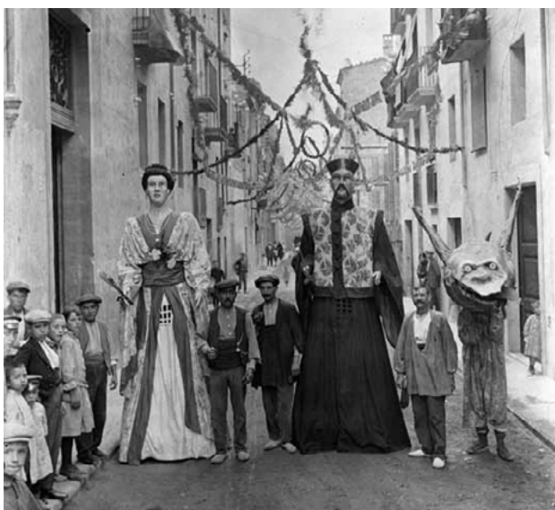
imatge de 1916, drac amb gegants del carrer d'Òdena.

cop sí, de barris. El que apareix a les fotos de 1922 podria pertànyer al carrer d'Òdena, i fou totalment renovat amb un altre aspecte el 1945.