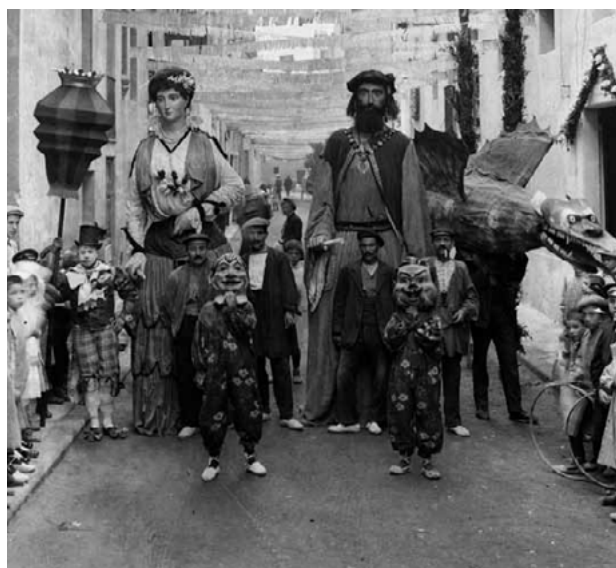
imatge de 1922, el mateix drac amb els gegants d'Igualada.