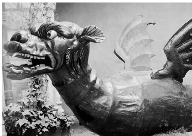
Drac de Vilafranca (ca. 1750-1780)