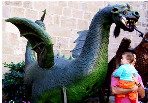
Drac de Solsona (1692)

Totes aquestes figures tenen en comú que el cap de talla de fusta massissa hi pren una gran importància i sol ser d'una gran bellesa, emparentada amb l'escultura de retaules del barroc. Estructuralment, es sostenen quasi sempre a través d'un quadre-marc per on entra el portador i d'una mena d'espina dorsal que fa d'arc de sostre i d'on baixen les rodelles que, a manera de costelles de bóta, permeten donar volum i consistència al cos. Damunt seu, un llenç de pintor, de lli o cotó, serveix de lligat a tot el conjunt i exerceix de suport de les escates o plomes que simulen la pell de l'animal, escates que solen ser de cuir repujat, pintat o daurat. En el cas dels dracs, solen tenir un cap que remet als cànids (llop, gos) i saures (sargantana, cocodril), o un híbrid entre aquests dos gèneres, amb morro més o menys allargat, grosses maixelles i dents i la boca oberta. És freqüent que hi hagi una llengua cap enfora, prominent,