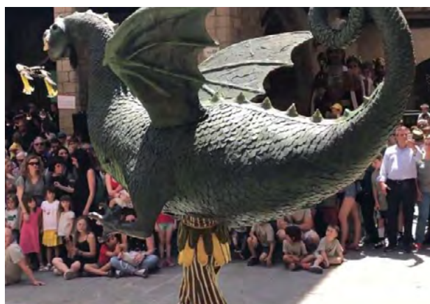
Drac de Solsona (1692)