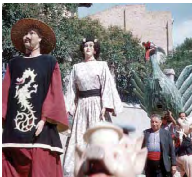
imatge de 1953. El drac del carrer d'Òdena. Sembla que va substituir el que apareix a les dues imatges anteriors. Es va estrenar el 1945