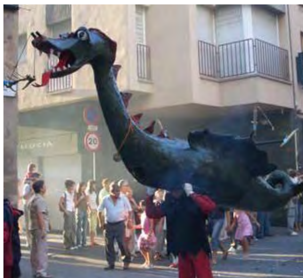
Drac del 1981.