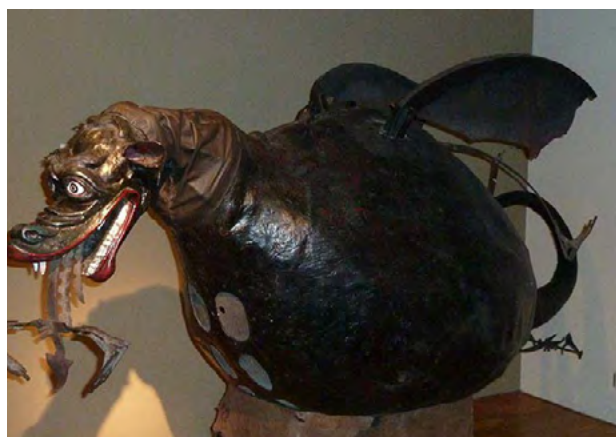
Drac de la bisbal d'Empordà (1675-1775)