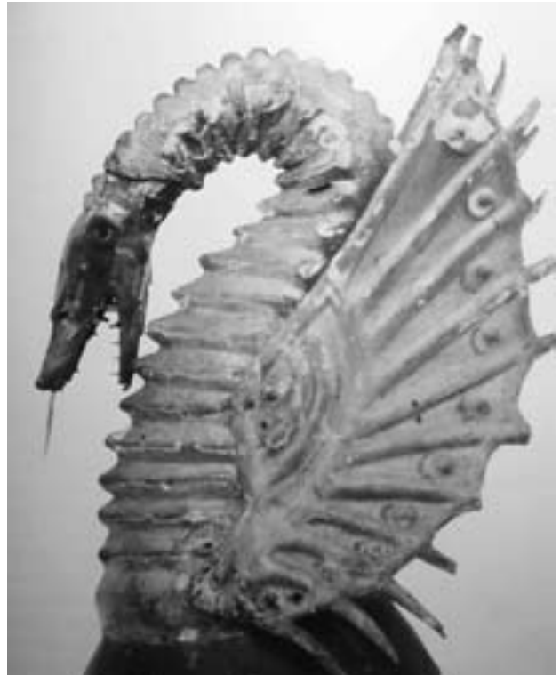
Cimera reial amb la vibra. Any 1407. Insignia creada el 1343.

S'ha conservat a Igualada un dibuix o grafit molt notable en un manual notarial de 1327, però per les raons exposades, aquest dibuix hauria de datar del 1402-1404.