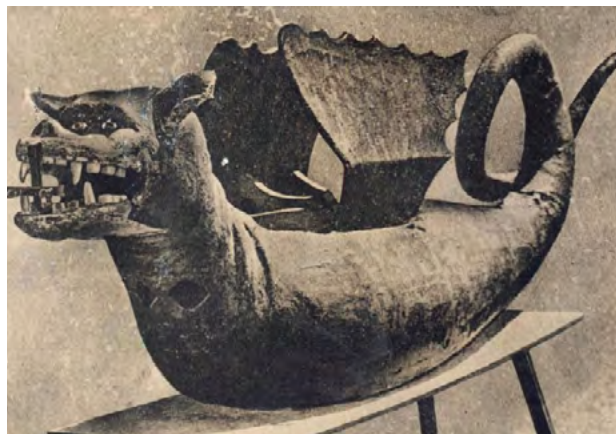
Drac de Terrassa (segle XIX?)